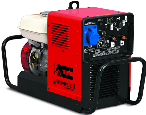
MOTOINVERTTER 174 CE