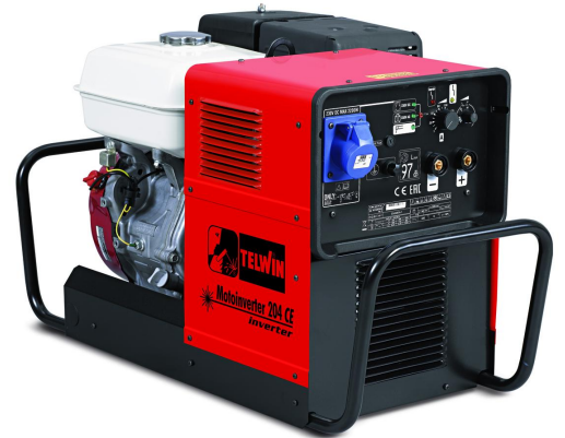
MOTOINVERTTER 204 CE