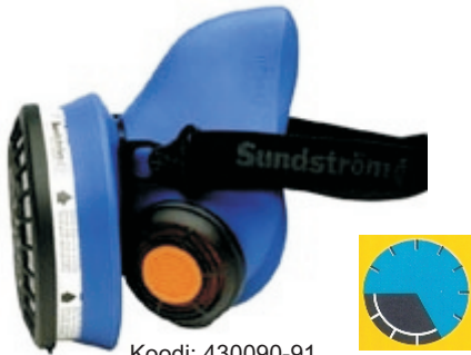
Koodi: 430090-91 SR-100 ML/SM