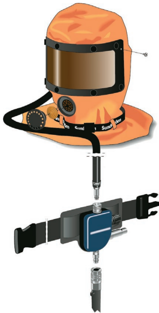
SR 63-10 HUPPU

Kokonaamari SR-200 valmistetaan neopreeni- ja SR 92 silikonikumista. Iso vaihdettava näköedustasuojaa silmät ja kasvat ärsyttäviltä aineilta. Naamareihin voidaan liittää paineilmalaitte SR 307. EN 136:1989