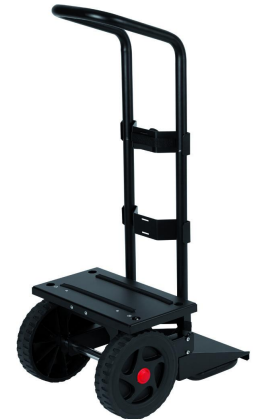
Kärry : Europa 802073