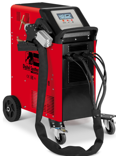
DIGITAL SPOTTER 9000