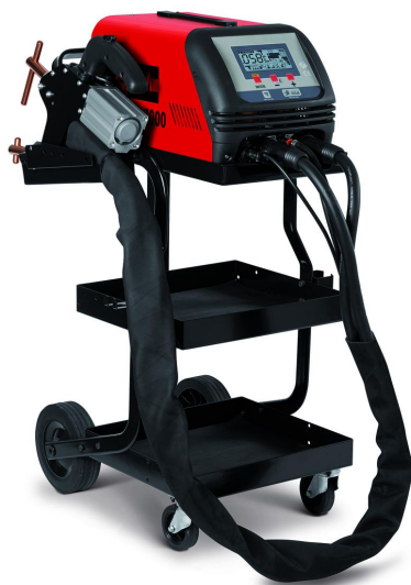
DIGITAL SPOTTER 7000