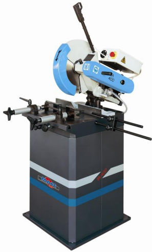
TA 400 - terä kallistuu 45° vas.