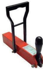
350 R1 - R2