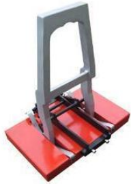
MOD 1200 S