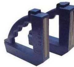
B 40 - 80