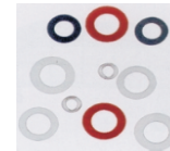
Välimutterit CO 2 -Argon Argon-CO 2