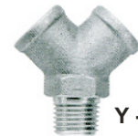
Y - haara